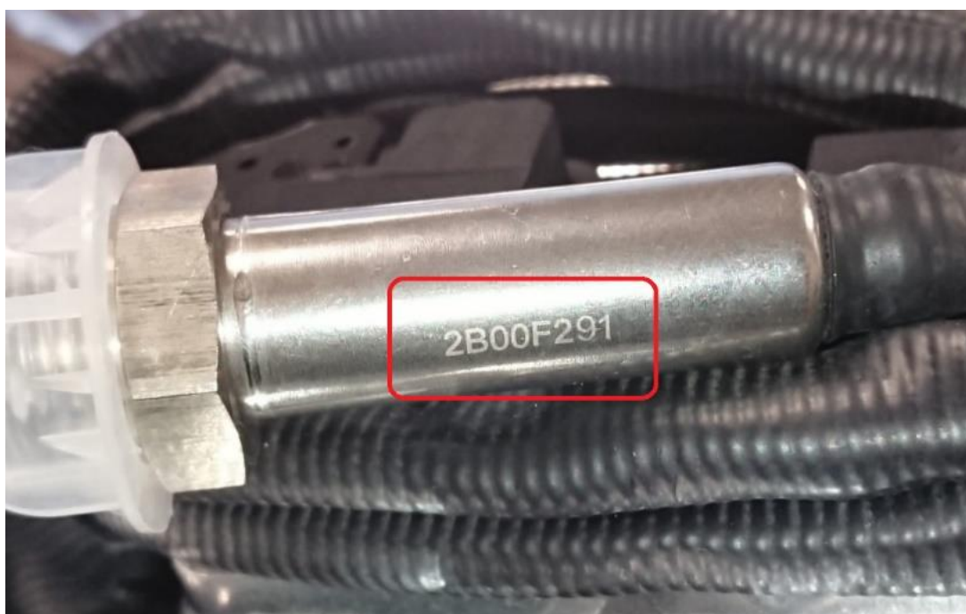
Rys. 2 – Nr seryjny (na sondzie czujnika)