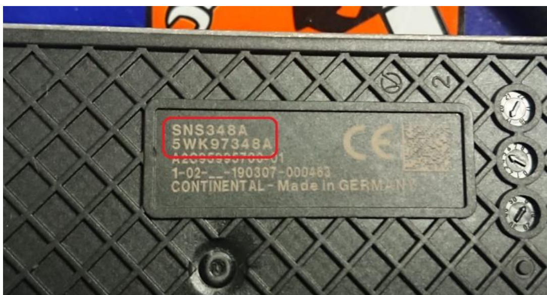
Rys. 3 – Nr Continental – (na obudowie czujnika, od spodu)